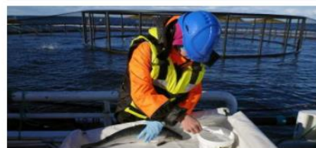
Lakselusa koster oppdrettsnæringen i Norge 167 milliarder kroner* i 2021