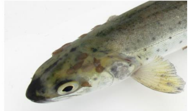
Sjørøret med lakselus.