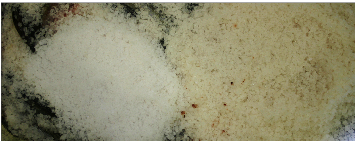
Lite parti nytt salt lagt over salt i bruk for å vise kontrasten.