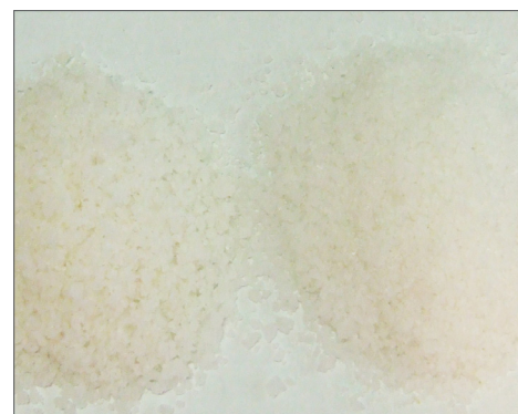
Nytt salt til venstre i bildet og brukt salt til høyre. Det brukte saltet har vært benyttet til å salte lakeinjisert fisk og viser seg svært rent.

Det største ankepunktet mot gjenbruk av salt har vært faren for gulning av fisken og fremvekst av rødmidd. Resultatene fra forsøkene Møreforskning så langt har gjort, har ikke påvist en økende synlig vekst av rødmidd. Nå ønsker man imidlertid å koble seg på andre prosjekter som omhandler rødmidd og få gjennomført mer omfattende studier.