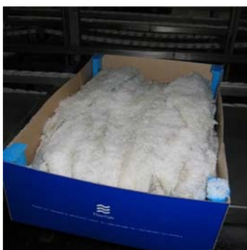
Figur 3.4. Pakket saltfilet.