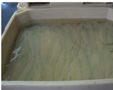
Figur 3.1. Lakesalting av filet.

plassert i produksjonslokalene uten temperaturstyring. Fisken ble deretter tørrsaltet i kar fra 14 til 21 dager, der en brukte fra 1 til 2,5 kg salt pr. kg fisk. Bedriftene som ble besøkt benyttet seg ikke av saltstrøer, men store slanger (Fig. 3.2) der hver fisk ble dekt med salt (Fig. 3.3). Karene ble deretter tippet over på rist for utsortering av fisk og salt (Fig. 3.5 til 3.8), og pakket (Fig. 3.4). Saltfisken ble pakket med nytt salt.