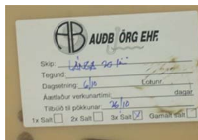
Figur 3.9. Merke på kar der saltet er benyttet for tredje gang (3x).

Det blir i all hovedsak benyttet sjøsalt fra Tunisia i produksjonen, både til lake og til tørrsalting. Islendingene har ikke lov å bruke brukt salt i laken, men til tørrsalting blir saltet brukt inntil 5 ganger. Bedriftene blander aldri nytt og gammelt salt. Karene med brukt salt blir merket med antall ganger det har vært brukt (Fig. 3.9) og ved tørrsalting med brukt salt benyttes salt med samme antall gjenbruk i samme kar. Dette gjør at en kan holde orden på hvor mange ganger saltet har vært benyttet. Benyttes brukt salt ved tørrsalting ble saltetiden forlenget. Eksempelvis er saltetiden med nytt salt 14 dager og ved bruk av brukt salt (x2), 16 dager saltetid. Brukt salt blir lagret i