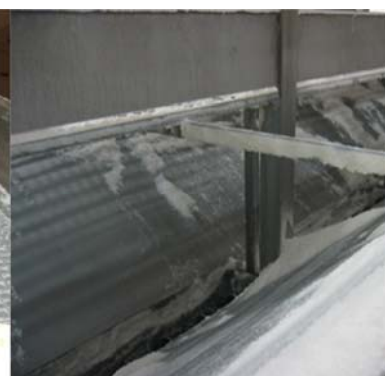
Figur 3.6. Oppsamler under ristene.