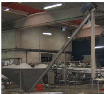
Figur 3.2. Utstyr til salting av fisk i kar.