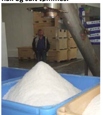
Figur 3.8. Brukt salt samlet opp i kar.