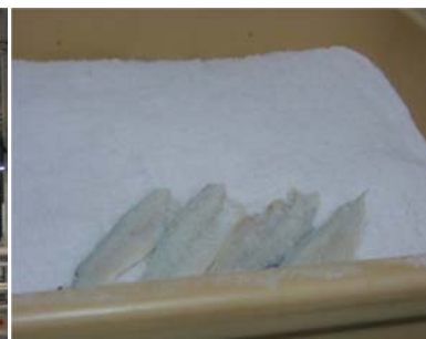
Figur 3.3. Filet til tørrsalting.