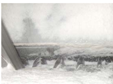
Figur 3.7. Skruer som overfører salt til kar.