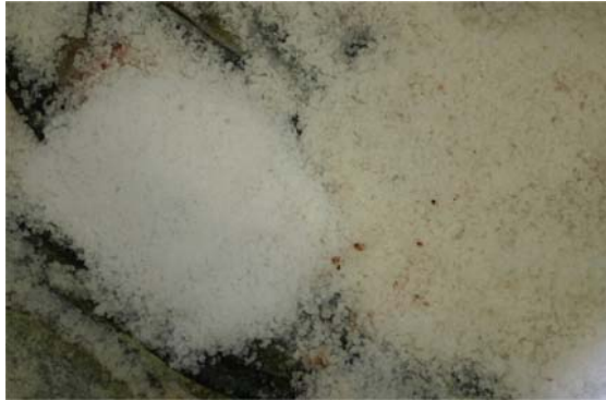
Figur 3.10. Viser nyttsalt (venstre) og brukt salt (høyre). Her er saltet benyttet til pickelsalting av fersk torsk, ca. 0,5 kg salt pr kg fisk.