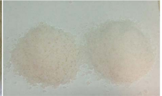
Figur 3.11. Viser nytt salt (venstre) og brukt salt (høyre). Her er saltet benyttet til tørrsalting av injisert filet, ca. 1. kg pr kg fisk.