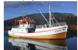
Kystfartøy under 22 meter ønskes som deltakere