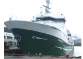
Trålere: ønskes som deltakere