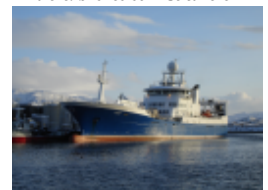
Ringnotfartøy ønskes som deltakere