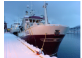
Kystnot ønskes som deltakere