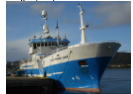
Autolinefartøy ønskes som deltakere