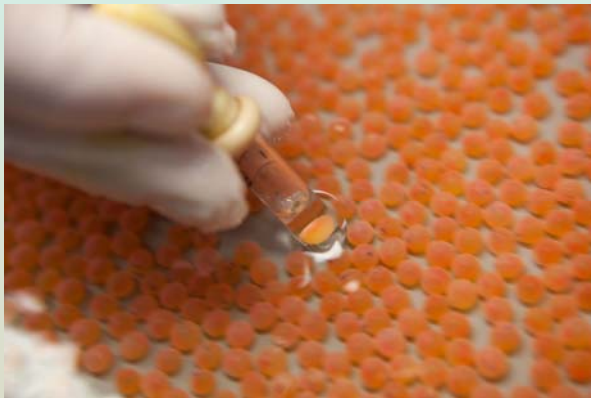
Høsten 2010 kan SalmoBreed levere rogn som er skreddersydd for økt motstandsevne mot PD og lakselus.

"Det er utrolig kjekt å lykkes, og nå kunne tilby rogn hvor vi har selektert for ekstra motstandsdyktighet mot lakselus og PD i tillegg til de andre sykdommene som allerede er implementert i utvalget vårt" sier Melingen. Han opplyser at de i tillegg har spennende arbeid i gang for ILA og utelukker ikke at det også kan bli aktuelt å tilby spesialprodukt som har en økt motstandsevne mot ILA kommende sesong.