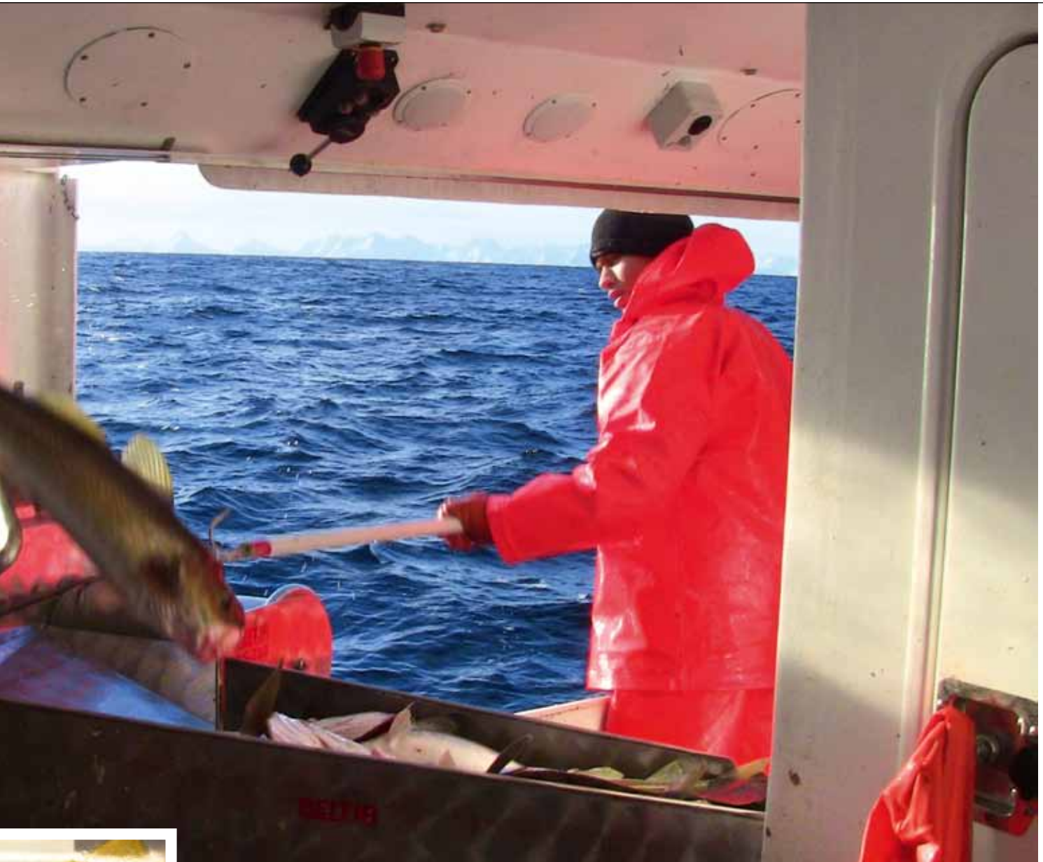
▲ Krokfangst er en samlebetegnelse som inkluderer mange ulike typer fiskeredskaper og metoder, inkludert håndsøre, dorg, autoline, flyteline, bunnline, med flere. I noen fangstområder vil disse metodene kunne gi uønsket bifangst av sjøfugl, skilpadde, hai og andre arter. En generell påstand om at krokfangst bidrar til bærekraftighet representerer derfor ikke nødvendigvis den hele og fulle sannhet.