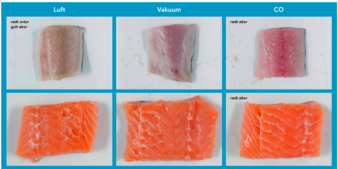
Figur 1. Makrell (øverst) og laks (nederst) endrer farge avhengig av lagringsatmosfære.

Endringer i laksefarge under lagring har foreløpig ikke kunnet forklares fullt ut, og lagringsforsøk med laks for å undersøke fargeforandringer har ofte gitt motstridende resultater. Nå viser ny forskning at fargen også påvirkes av atmosfæren under lagring og mengden blod i filetene.