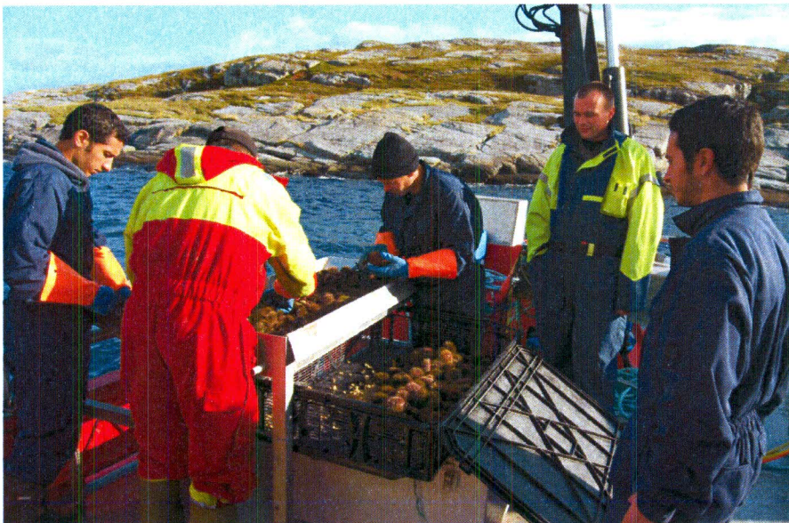
Bilde fra første forsøk i September 2009

Vi planlegger nå å gjennomføre videre uttesting på kamskjell i første omgang, samt å prøve utstyret på andre arter. Det er imidlertid svært interessant å kunne fortsette uttesting på kråkeboller da vi tror det kan være svært tids og kostnadsbesparende mot å bruke dykkere samt at det kan åpne for høsting i områder der dykking ikke kan gjennomføres.