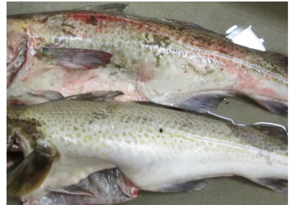
Bildet viser en sjøddød torsk og en feilfri torsk