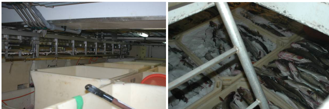
Bilde 9 Det er trangt i lasterommet, til høyre slurry-iset fisk i kar

via slanger fra tanken og til lageret. Dette fungerte fint under denne turen. Isslurrien hadde en isandel på ca 30 % og holdt en temperatur på ca -2,5 °C på tanken.