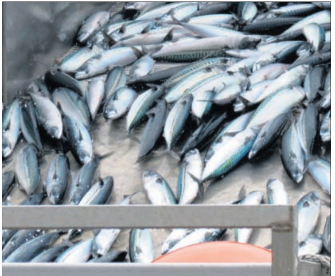
MAKRELLFANGST: Lossing av makrell i Norge.

ngen dro fra Husøy sist helg. Det var derimot helgen da alle kom hjem. En gang i året er Husøy i alles bevissthet, og det er flott at Husøydagan har klart å utvikle seg til å bli en hovedarena for å diskutere fiskeripolitikk. Og i motsetning til da damene drog på TV2, samlet de seg nå blant mennene på kaia. I fjor kom Erna, i år Lisbeth. Kan det være noe med alle hankjønnene på Husøy?