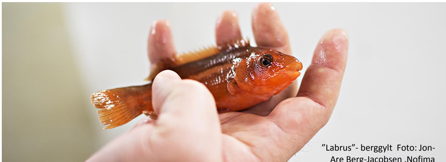
"Labrus"- berggylt