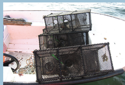
Figur 2: Teinene som ble brukt ble egnet med kokte reker.