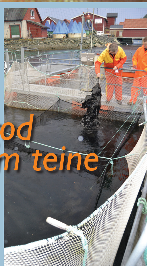
Figur 1: Rigging av notposene brukt i overlevelsesforsøkene. Bildet viser også tareskjulet som ble brukt.

Blant argumentene mot rusefisket er både egenskaper ved selve redskapet og at det ofte kreves lengre ståtid for ruser enn for teiner for å oppnå kommersielle fangster. Ved fiske med ruser benyttes som regel en ståtid på ett døgn, mens teiner