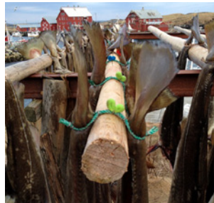
Test av forskjellige kombinasjoner av tau og ringer

Tauet bindes i 2 løkker rundt sporen på 2 fisk, hver løkke festes med stålkramper. Det er en avansert og presis produksjonsprosess, programert ned til minste detalj. Maskinen er konstruert med stor vekt på det tøffe produksjonsmiljøet den skal arbeide i. Den er konstruert og bygget av kvalitets komponenter, beregnet for industriell bruk. Maskinen er basert på både trykk-luft og strøm.