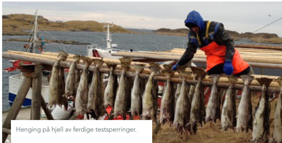
Henging på hjell av ferdige testsperringer.