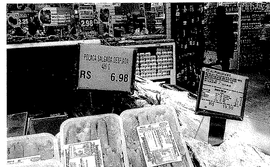
Saltet alaska pollock er blitt et stadig vanligere syn i brasilianske supermarkedskjeder. Produktet er ofte pakket i små pakninger, slik at enhetsprisen blir lav.

Pris er viktig for de som kjøper saltet alaska pollock. Prisseksampler fra supermarkedskjeden Arco Iris i den fattige bydelen Barro