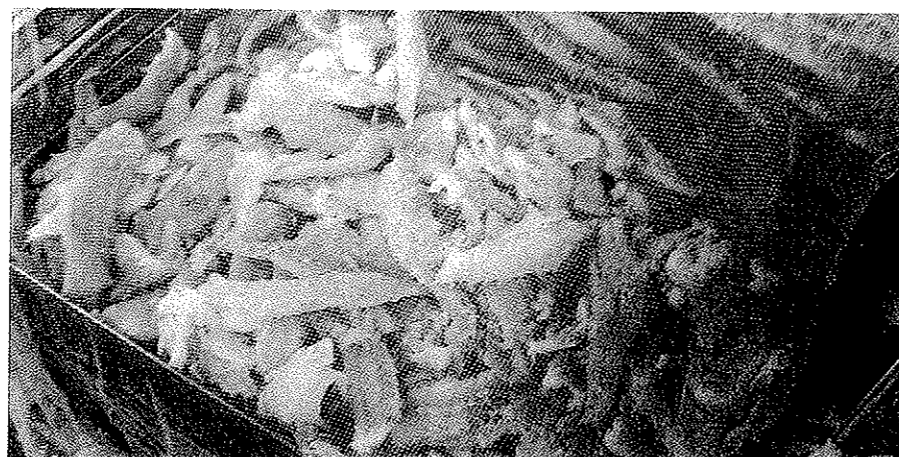
Saltet alaska pollock i løsvekt uten merking til forbruker. Bildet er tatt i en fattig bydel i Recife i Nordøst-Brasil.

Middelklassen spiser gjerne klippfisk i forbindelse med høytider eller spesielle merkedager. Billigere og mer bekvemmelige produktalternativer gir dem muligheter til å spise saltet og delvis tørket fisk mer regelmessig. Saltet alaska pollock selges ferdig opprevet og er dermed enklere å tilberede enn seien som enten selges i