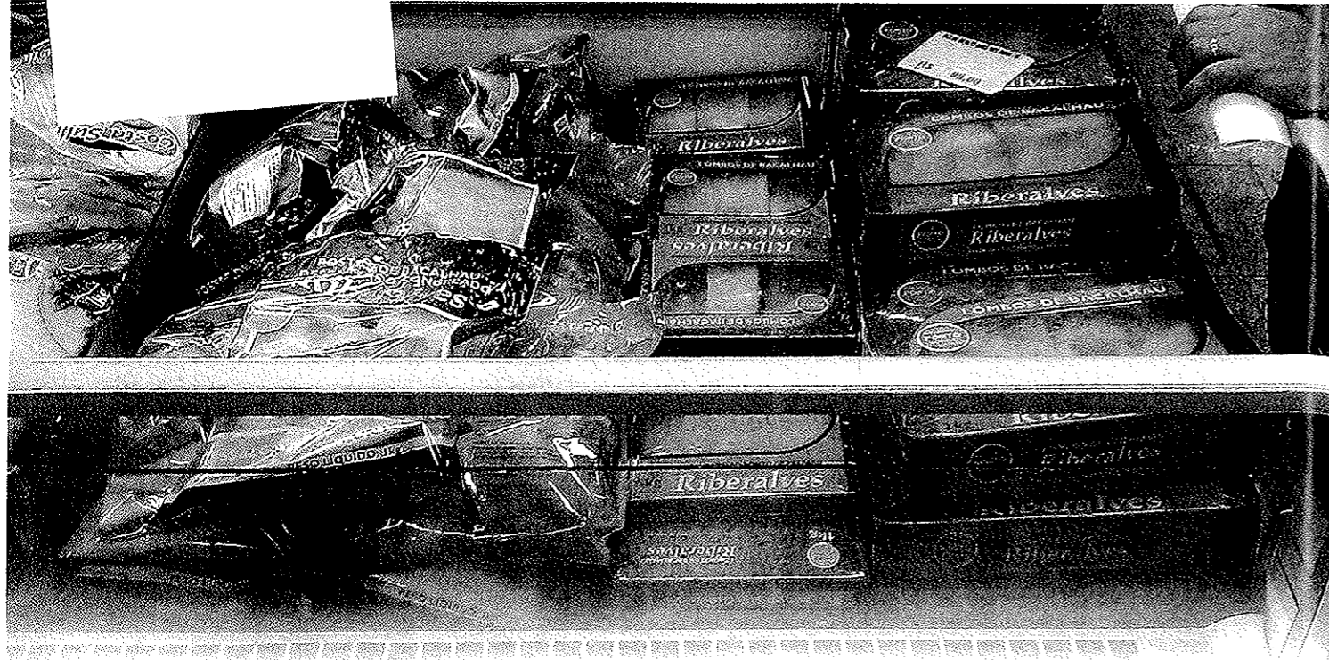
Frysede utvannede klippfiskprodukter får stadig større plass i brasilianske frysedisker, her fra supermarkedskjeden Mundial i Rio de Janeiro.