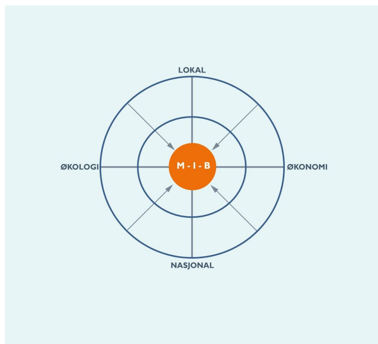
Figur 2: To ulike handlingsrom (Fra Flemsæter m fl 2013)

Vi vil i det følgende peke på det vi ser som noen hovedfunn eller -tema fra datamaterialet fra regionmøtene med oppdrettsnæringa og forvaltningen (se del 2), og forsøke å knytte dette opp mot Vinn-vinn-modellen.