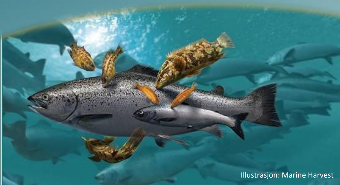
Illustrasjon: Marine Harvest

Dette nyhetsbrevet bruker vi til å gi innblikk i noen få av nyhetene som presenteres på årets: