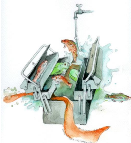
Illustrasjon: Stein Mortensen

Påmelding: https://event.nho.no/skjema/?event=2425