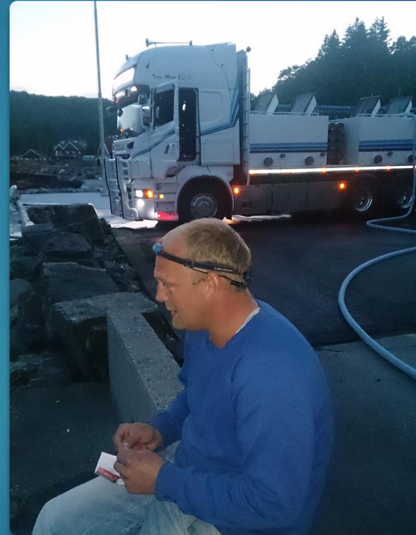
Pause trenger man ;-)