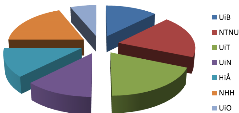
Figur 2: Deltakere fordelt på studiested