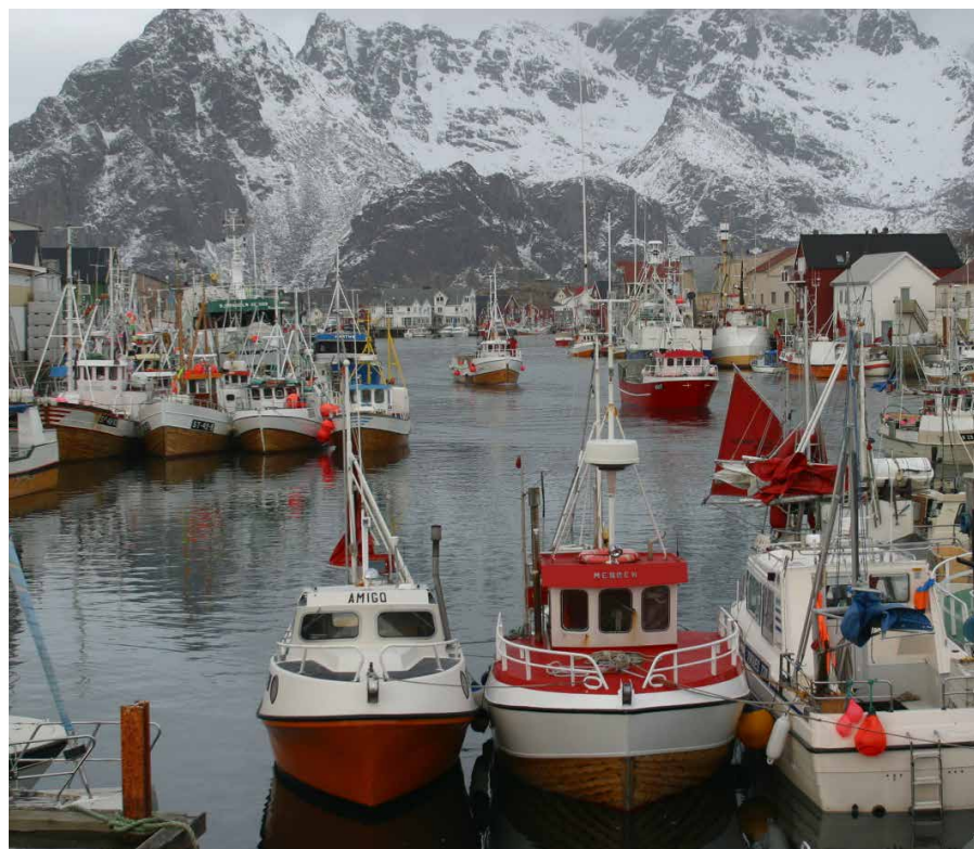
Kravet om adskilte fangster oppleves som spesielt krevende for de bedriftene som mottar mange og små fangster.

Fra landingsforskriften ble utarbeidet og til den trådte i kraft, gikk det nesten ti år. I løpet av denne tiden har effektivitetskravene blitt sterkere, og det har blitt stadig vanligere å levere hvitfiske usløyd. Forskriften har ikke tatt høyde for dette. Hovedfokus i denne undersøkelsen var å belyse bedriftenes erfaringer med den nye forskriften, noe som naturlig nok gjenspeiles i våre vurderinger. Resultatene viser imidlertid at en utvidelse av ressurskontrollen til også å dekke foredlingsleddet ikke har gått knirkefritt. Basert på intervjuene som er gjort, ser vi derfor et behov for at myndighetene innleder et samarbeid med fiskesalgslag og næringsorganisasjoner og justerer forskriften slik at den blir enklere å etterleve for alle.