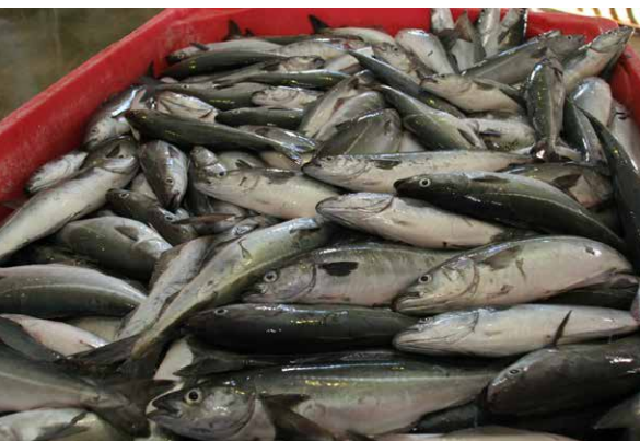
Den nye landingsforskriften inneholder blant annet nye krav til adskillelse av fangst. For mange bedrifter betyr dette at fangstene må holdes adskilt gjennom hele produksjonsprosessen.

I de pelagiske fiskeriene nevnes ikke det nye journalføringskravet som problematisk å gjennomføre, men det oppgis at nye krav til vekrutiner utgjør et rent effektivitetstap.