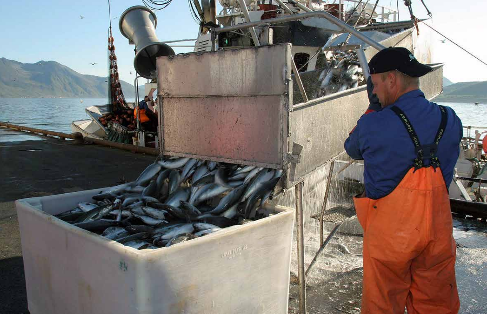
Nye krav i den nye landingsforskriften har som mål å gi økte kontrollmuligheter for myndighetene. Dette har skapt stor frustrasjon blant fiskekjøpere i hele landet.