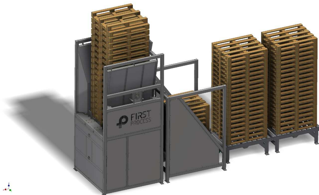
Figur.2 Illustrasjonsbilde av komplett oppsett pallesner

Det blir laget en video av utstyret utviklet i prosjektet. Utover dette er det ikke planlagt noe fakta ark, eller vitenskapelige artikler.