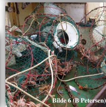
Bilde 6 (B Petersen)