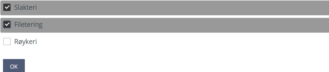
Figur 2: I dette steget er det mulig å huke av for flere alternativer.

(det er mulig å velge flere svaralternativer)