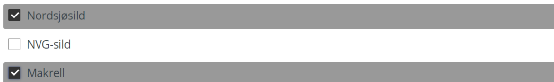
Figur 4: Eksempel, rapportering ved fiske på nordsjøsild og makrell.

Matsvinn fra pelagisk sektor beregnes basert på massestrømbalanse (på lik linje som for lakseslakteri og -foredling og hvitfiskmottak og -foredling). Mer om hvordan denne rapporteringen gjøres kan leses i kapittel 2.6.