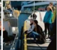
* I tillegg til skolebarn og studenter, er det også mange som er på kurs for å lære mer.