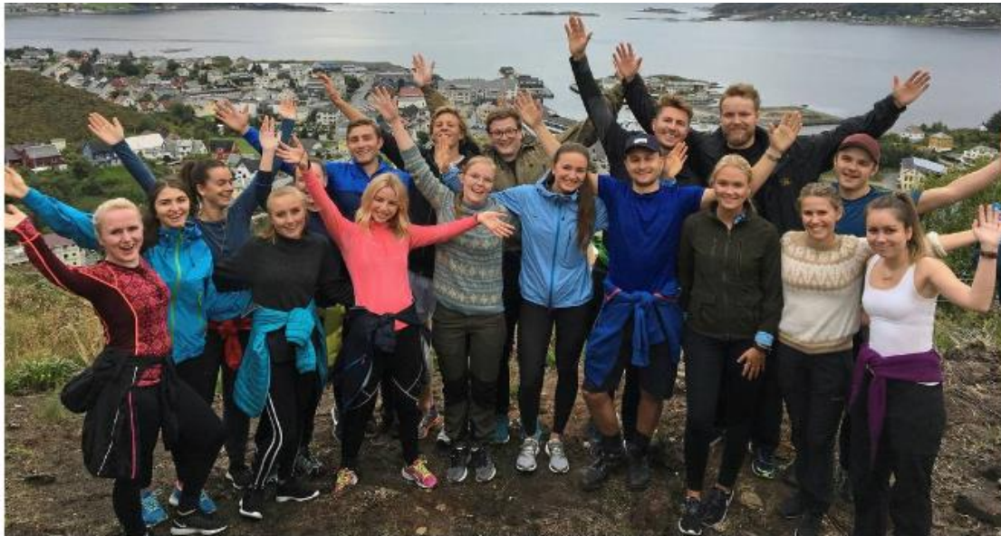
BOOTCAMP universita marine bo uken.