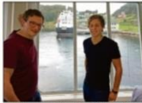
* Mange skolebarn studerer årets Lærere i Norge og årets Gullne Matvare med innsett i skoleplanen i helgesemester.