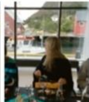
* Programmet i Fosnavåg er utviklet og utvikles videre av studenter på Fosnavåg Pilgrims.