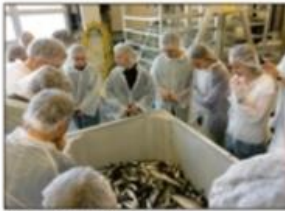
* Devisering på Fosnavåg Pilgrims.