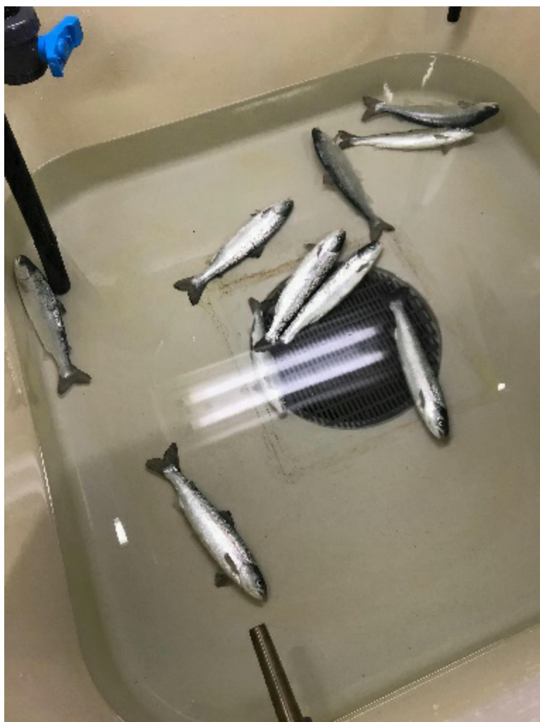
Bilde 1. Laks opplever kuldesjokk og ligger på bunnen av karet etter noen minutter ved -1 °C.

overført fra 8 til 0,5 °C ble det ikke observert immobilisering.