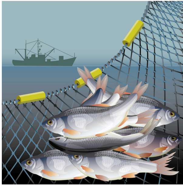
I GARNET: Norsk fiskeeksport er viktig for vårt forhold til EU og EØS.

På det juridiske området reiser avgrensningene av EØS-avtalens anvendelsesområde, og EFTA-domstolens praksis i tilknytning til bestemmelsene om dette, en rekke problemstillinger om reguleringsfrihet når det gjelder investeringer, arbeidskraft, tjenester og statsstøtte i fiskeriene og havbruksnæringen, og i miljørelaterte spørsmål. Drøftelsene viser at en NOREXIT ville medføre at det rettslige handlingsrommet formelt sett ville øket, men at norske eksportører fremdeles måtte ha forholdt seg til EUs standarder og konkurranserett. Der styrkeforholdet er skjevt, er det ikke åpenbart at økt selvråderett er noen fordel for den svakeste parten. Det kan derfor spørres hvor mye større det reelle handlingsrommet ville blitt. Fremstillingen viser også at EØS-retten er en viktig garantist for beskyttelse av miljøhensyn knyttet til havbruksnæringen. Med en NOREXIT kan det ikke utelukkes at miljøhensynene i større grad ville blitt veid mot andre hensyn, og dermed også måtte ha veket i tilfeller der EØS-retten i dag er til hinder for det. Analysene her bør være av interesse for alle som ønsker å reflektere rundt reguleringsfrihetens pris.