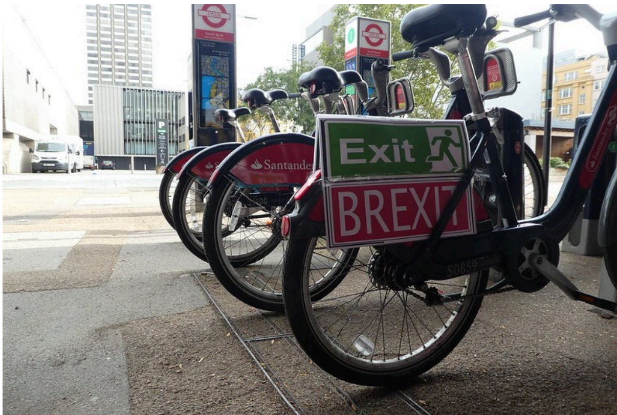
NOREXIT: I 2016 valgte britene en Brexit. Kan Norge også få en EØS-exit?.

Norge har også en angst for at EØS-avtalen kan «komme i spill», dempet iveren for slike reformer.