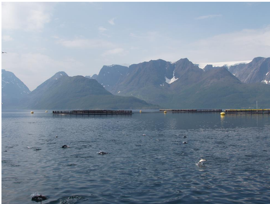
Figur 4. Sei ved oppdrettsanlegg i Øksfjord

Det er vist at til dels store mengder villfisk kan tiltrekkes oppdrettsanlegg. I Norge har Dempster mfl. (2010) anslått et gjennomsnitt på rundt 10 tonn villfisk periodevis samles rundt oppdrettsanlegg på ett gitt tidspunkt i sommerhalvåret. Dempster mfl. (2009, 2010) estimerte kun biomasse nært merdene og anslaget er derfor trolig et underestimat. Dette støttes av observasjoner fra Ryfylke som indikerer at betydelig større mengder sei (>100 tonn) kan samles ved lakseanlegg.