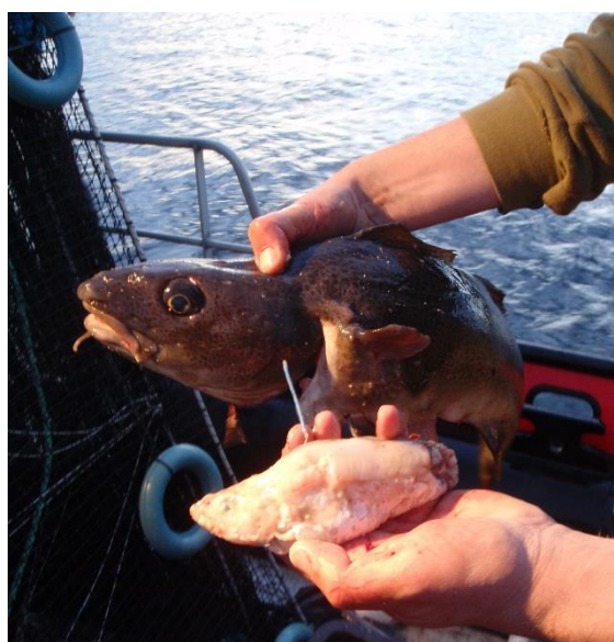
Figur 6. Merket torskeyngel spist av torsk fanget ved oppdrettsanlegg

En annen mulig årsak til tiltrekning er at større villfisk lokkes til oppdrettsanlegg fordi mindre byttedyr også samles der. Både Dempster mfl. 2011 og Sæther mfl. 2012 dokumenterte at større torsk og sei fanget ved oppdrettsanlegg hadde spist mindre fisk, hovedsakelig småsei, som trolig var tiltrukket anlegg på grunn av tilgang på spillfôr (Figur 6). Serra-Linares mfl. (2013) viste også at større torsk og sei som oppholdt