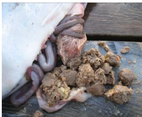
Figur 5. Sei med spillfôr i magesekken

Det er gjort få systematiske forsøk på å måle i hvor stor grad spillfôr utgjør dietten til villfisk i nærheten av oppdrettsanlegg. I Norge er det påvist at laksepellets i gjennomsnitt utgjorde henholdsvis 71 % og 25 % av dietten til sei og torsk fanget i nærheten av oppdrettsanlegg i sommerhalvåret (Dempster mfl. 2011). Nesten 44 % av seien hadde pellets i magesekken, mens den tilsvarende andelen for torsk var 20 %. Sei og torsk fanget på kontroll-lokaliteter hadde ikke laksepellets i magesekken. Sæther mfl. 2012 viste også at torsk av ulik størrelse varierte med hensyn til hvor mange som hadde pellets i mageinnholdet. Andelen av torsk som var mindre (N=34) eller større (N=46) enn 60 cm som hadde spist pellets var henholdsvis 32 % og 11 % (Sæther mfl. 2012).