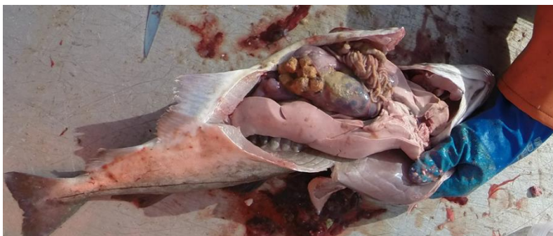
Figur 9. Hyse med pellets i magesekken

Uglem mfl. (2017, 2020) undersøkte også smak og kvalitet hos sei fanget ved oppdrettsanlegg. Det ble i enkle smakstester (to ulike retter i forbrukertester) ikke påvist at sei fanget nært oppdrettsanlegg smakte vesentlig dårligere enn sei fanget et stykke unna anlegg, men tvert i mot at ovnsbakt sei fanget ved oppdrettsanlegg smakte noe bedre enn upåvirket sei. Det ble også påvist mindre forskjeller i filet kvalitet for sei fanget ved oppdrettsanlegg og upåvirket sei, men forskjellene var i gjennomsnitt ikke store nok til at de kunne forklare de markante forskjellene som fiskere opplever. Andelen sei med vesentlig redusert filet kvalitet var imidlertid høyere for sei fanget nært oppdrettsanlegg enn kontrollsei. Dersom andelen av sei med redusert kvalitet blir høy nok kan den totale fangsten bli nedgradert på bakgrunn av dårlig kvalitet. Kvalitetsopplevelse kan også være relatert til andre faktorer enn reell kvalitet. Fisk med mye pellets i magesekken lukter og ser uappetittlig ut når den sløyes (Figur 9) og sei som har spist mye laksefôr over lang tid kan ha en unaturlig kroppsfasong, noe som kan bidra til å danne et inntrykk av at kvaliteten er redusert for såkalt «pellets-sei».