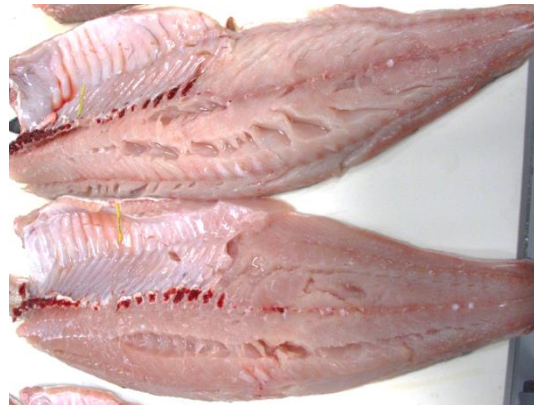
Figur 8. Sei som har spist mye spillfôr kan ofte være løse i kjøttet

Sæther mfl. (2012) undersøkte sei og torsk fanget ved oppdrettsanlegg sammenlignet med kontrollfisk fanget i områder presumptivt upåvirket av oppdrett. Det var generelt ingen vesentlige forskjeller i filetindeks mellom de ulike prøveuttakene eller mellom garnfanget kontrollfisk og levendefanget fisk fra oppdrettsanlegg som indikerte at fisk fanget nært anlegg avvek betydelig fra kontrollfisken. Det ble i sensoriske smakspaneltester ikke funnet store forskjeller mellom fisk fanget nært eller langt fra oppdrettsanlegg, men det var marginale forskjeller som tydet på at fisk fanget nært lakseanlegg var av bedre kvalitet enn fisk fanget langt unna anlegg. Otterå mfl. (2009) undersøkte om inntak av kommersielt fiskefôr påvirket konsumkvaliteten på sei ved å føre fisk holdt i kar med enten lakse- og/eller torskefôr i 8 måneder for deretter å sammenligne kvalitet hos oppforet fisk med villfanget fisk. Det ble ikke funnet vesentlige forskjeller for noen av de målte parameterne som tydet på at sei føret med fiskefôr var av betydelig dårligere kvalitet enn villfanget sei. Det ble konkludert med at sei føret på kommersielt fiskefôr generelt var av god kvalitet.