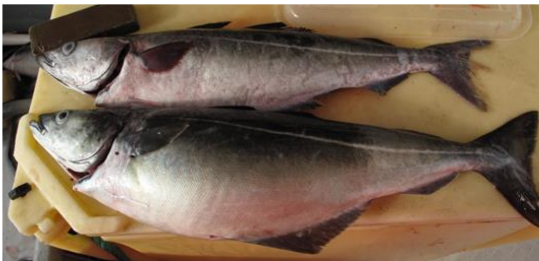
Figur 7. Sei som har spist spillfôr er ofte i god kondisjon

Utslipp av organisk materiale i form av spillfôr kan føre til økt vekst og biomasse hos fisk som samles ved anleggene. Det er gjort flere beregninger for å estimere om og i hvilken grad dette medfører riktighet. Det er også godt dokumentert at villfisk som tiltrekkes oppdrettsanlegg har større energireserver enn villfisk som er fanget et stykke unna oppdrettsanlegg (oppsummert i Uglem mfl. 2014, Figur 7).