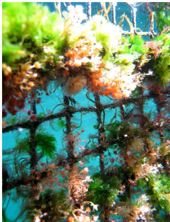
Figur 1. Groe på not

Uten tiltak vil groen vokse kontinuerlig og den kan forekomme i betydelige mengder (>8 kg m -2 ; Bloecher mfl. 2013). Oppdretterne ønsker av flere årsaker å hindre groe på anleggene og særlig noten, blant annet for å opprettholde tilstrekkelig vanngjennomstrømning og for å hindre at fortøyningssystemet påvirkes for mye av vannstrømmen. Groe kan også være et reservoar for patogener (Bannister mfl. 2019). I Norge håndteres begroing hovedsakelig ved impregnering av not med kobber-basert anti-groemiddel og regelmessig (opp til ukentlig) ved in-situ vasking av nøter. Vasking fører til at groeorganismene frigjøres i vannet (Carl mfl. 2011). Andre strukturer rengjøres bare ved behov (f.eks. 1-2 ganger i produksjonssyklus) (Bloecher mfl. 2015). Siden groen ikke ville ha oppstått uten oppdrettsanlegget og den frigjøres ved notvask og vask av andre strukturer kan groe betraktes som et organisk utslipp fra lakseanlegg.