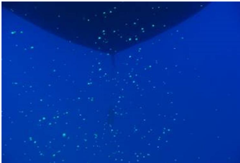
Figur 2. Spillfôr

Mengde spillfôr fra sjøbaserte oppdrettsanlegg bestemmes av fôringsregimet og har blitt antatt å være i størrelsesorden 3-7 % av utfôret mengde (Kutti 2008; Reid mfl. 2008; Otterå mfl. 2009; Torrison mfl. 2016). Den økonomiske fôrfaktoren har de siste årene ligget rundt 1,3 ( www.barentswatch.no/havbruk/foringrediens-til-fisk ), noe som indikerer at fôrspillet kan være høyere enn det som er antatt. En undersøkelse av fôrtap fra oppdrett i