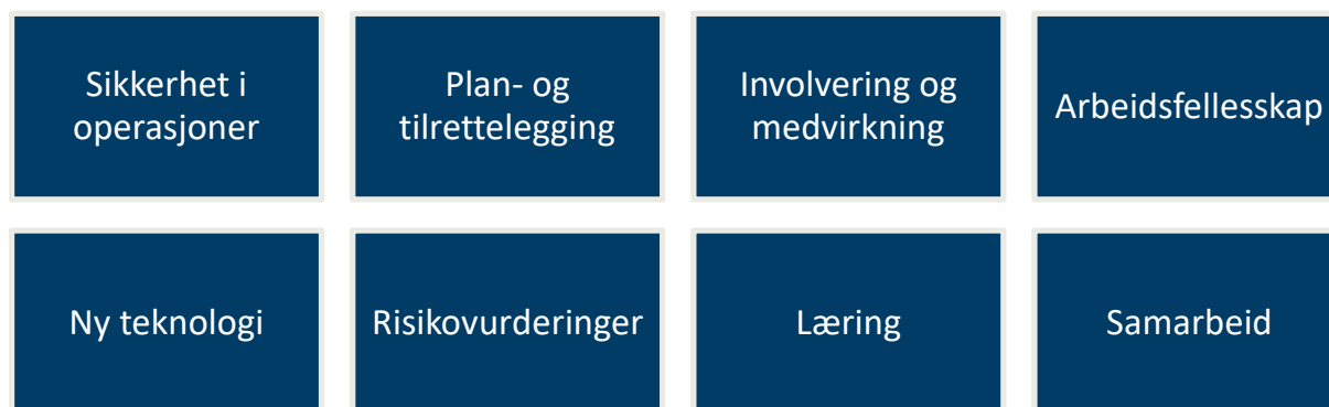
Figur 2 Kategorisering av tiltak presentert på nettstedet www.hmsihavbruk.no per 27.juni 2024.

Basert på resultatene fra prosjektet er åtte områder fremhevet som særlig viktige for tiltaksarbeidet i havbrukselskapene. Disse områdene er: sikkerhet i operasjoner, plan- og tilrettelegging, involvering og medvirkning, arbeidsfelleskap, ny teknologi, risikovurderinger, læring og samarbeid. Det vises til nettstedet www.hmsihavbruk.no for utfyllende informasjon om tiltakene og hvilke utfordringer de søker å løse.